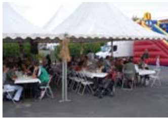
Le repas du 14 juillet