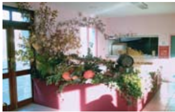
Le beaujolais nouveau

Nous tenons tout d'abord à remercier la collaboration des personnes présentes pour la préparation des fêtes du village. Sans leur aide, le comité des fêtes ne pourrait organiser toutes ces réceptions. Un grand merci à vous !!