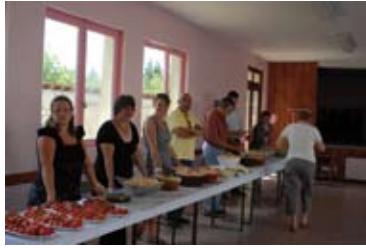
Une partie des bénévoles